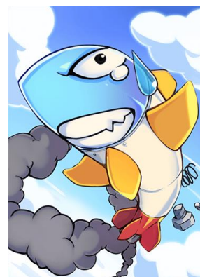
★4 召喚獣「不良品ゼニット」