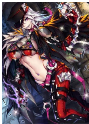
★6 召喚獣「コードネーム：クロウ」