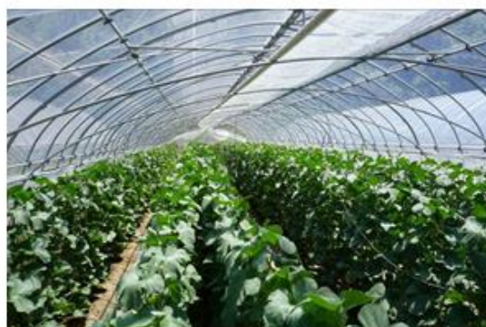
『サムライメロン』のハウス