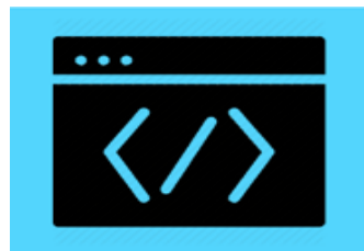
マイクが拾った風による雑 音が大きすぎた場合は、風 を回避するアルゴリズムに よって調整