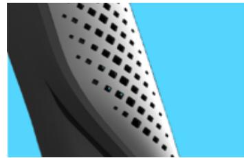
ウィンドスクリーンが マイクに当たる風の第 一層を遮断