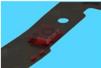
各マイクを 「ウィンドボックス」 で保護