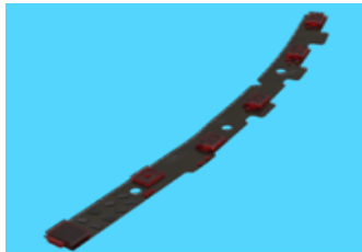
4 台の無指向性マイク で音声と周囲の雑音を 的確にキャッチ