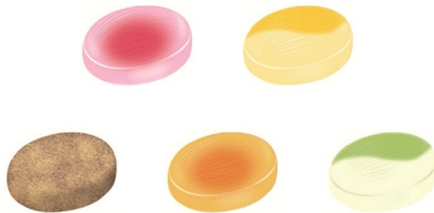
上段左から「山形 佐藤錦さくらんぼジュレ」「北海道 かぼちゃプリン」 下段左から「沖縄 黒糖きなこ」「鹿児島 安納芋スイートポテト」 「京都 宇治抹茶豆乳ラテ」の各キャンディ>