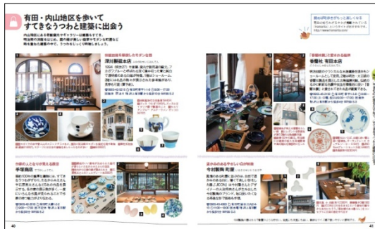
<有田紹介ページ例>

そのほか、エリアごとの旅もご提案しています。「有田・伊万里」では工房見学ができる窯元や、有田焼・伊万里焼のうつわで楽しめるランチ・カフェスポット、うつわとコラボしたかわいいおみやげ等の情報を収録。「武雄・嬉野」では楼門がシンボルの武雄温泉、日本三大美肌の湯として女性にも人気の嬉野温泉の楽しみ方を中心に、カフェ・スイーツスポットも紹介。「唐津」では唐津焼のギャラリー巡りをはじめ、唐津ならではの洗練されたグルメ、スイーツスポット、唐津の魅力を味わえる憧れのお宿など、唐津焼と自然、グルメスポットを紹介しています。