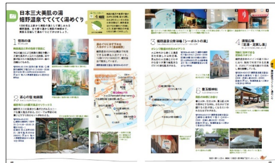
<嬉野紹介ページ例>