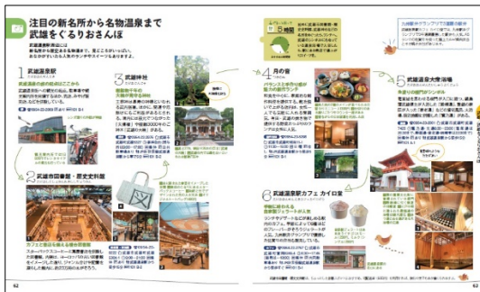
<武雄紹介ページ例>