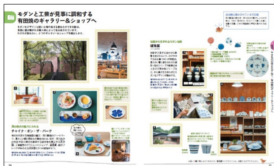
＜有田焼紹介ページ例＞

巻頭特集の「やきものの里を訪ねて」は有田焼や伊万里焼、唐津焼などの多くの窯元・ギャラリーを訪ね、その土地の魅力を感じながらお気に入りのうつわを探せる構成です。