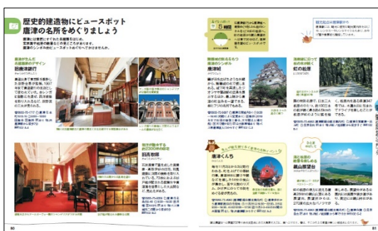
<唐津紹介ページ例>