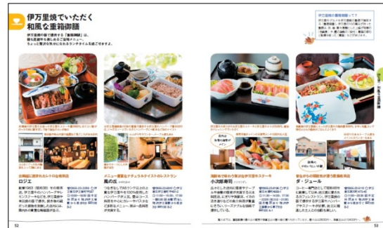
<伊万里紹介ページ例>