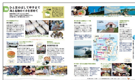
<呼子紹介ページ例>