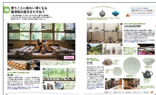
＜唐津焼紹介ページ例＞