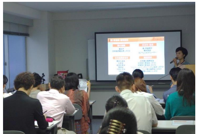
▲インバウンドビジネス転職応援セミナーの様子

やまごころキャリアは、登録会員（求職者）を支援する「インバウンドビジネス転職応援セミナー」を過去3回開催しています。4回目の開催となる今回は、現場で求められる英語力にスポットを当て、やまごころキャリアのサイトに求人情報を掲載中の複数企業にヒアリングした実態と、英語を業務で使用している転職成功者のお話を交えて、登録会員が具体的にキャリアを考え、不安なく就職活動に臨んでいただくことを目的とします。また、登録会員が会員同士、またインバウンド業界ですでに活躍している転職成功者と顔を合わせて交流することで、情報交換や刺激を受けるとともに、インバウンド業界でのキャリアを切り開いていく原動力を提供する場として活用いただけます。