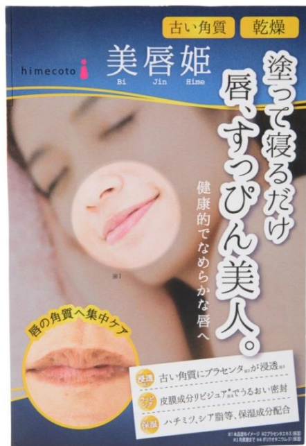
美唇姫(びじんひめ) パッケージ画像