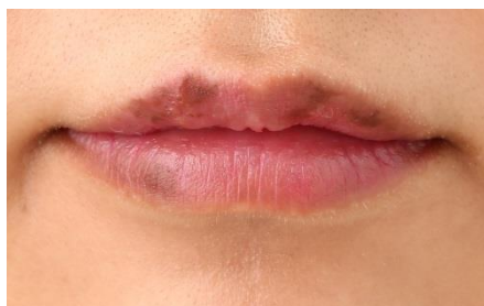
黒ずみとくすみによる不健康な唇

■美唇姫ナイトパック EC サイト： http://nonplex.jp/item/1471