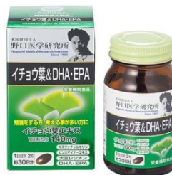
イチョウ葉 & DHA・EPA 価格 2,580円