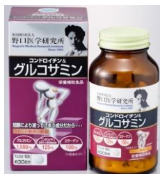
コンドロイチン & グルコサミン 価格 1,980円