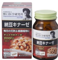
納豆キナーゼ 価格 2,980円