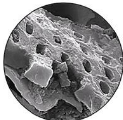
電子顕微鏡写真で見た活性炭表面