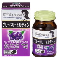
ブルーベリー & ルテイン 価格 2,980円