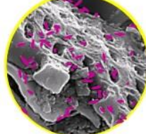
サルモネラ菌に 着色加工処理