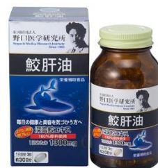
鮫肝油 価格 1,980円