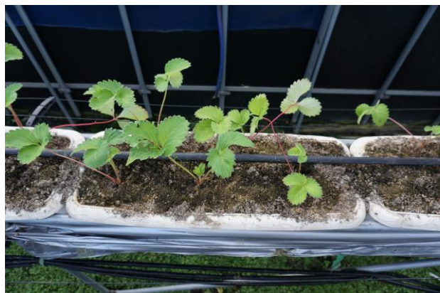
1 区画に 5 株の苗を保有

『こっそり農遠』は、都市部に住むユーザーにスマートフォンを通してリアルな栽培体験を提供し、それぞれの故郷の特産品を遠隔地に居ながら応援するといった地方創生に繋がる画期的なサービスです。