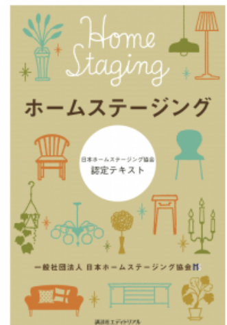
認定テキスト（表紙）

「ホームステージング」は、お片づけ・掃除・インテリアを含めたトータルコーディネートで魅力的に演出し、不動産売買を円滑にするためのサービスとして、アメリカでは30年以上前から広く一般に知られています。日本の住宅事情に合った日本独自のホームステージングに関する知識やノウハウを体系化したものが、ホームステージャー認定講座です。これまでに約500人が認定資格を取得しています。2級を取得すると1級認定講座を受講でき、さらに目的別・テーマ別の実践手法や、ホームステージングを実際の業務に生かす方法を習得できます。