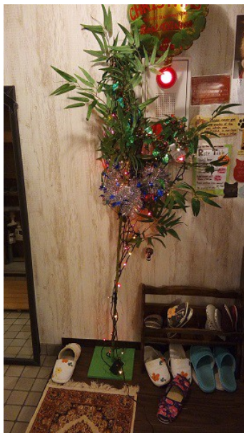
笹で作った和風のクリスマスツリー