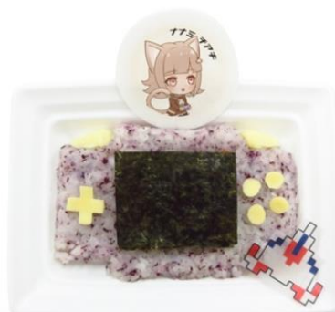
「名作だよ！超名作だよ！！」七海の愛用ゲーム機ごはん 価格：880円