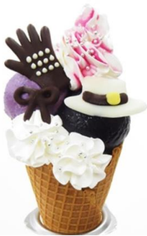
「もっと自分の感情を出していいと思うよ。」霧切と黄桜の世話焼きジェラート 価格：800円