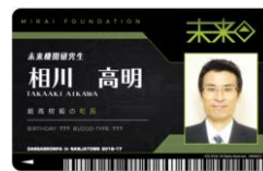
▲ナンジャタウンの相川町長は“超高校級の町長”に！

対人推理アトラクションの参加者にスタンプカードをお渡しし、参加1回毎にスタンプを1つ押印します。スタンプを4つ集めると、「未来機関研修生IDカード」または「希望ヶ峰学園学生証」を発行します！