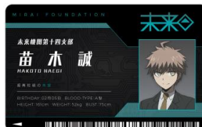
【IDカード(未来機関) (全18種)】