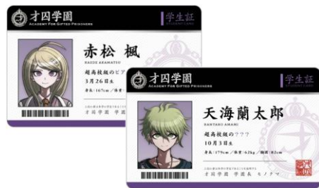
【学生証カード(オ囚学園) (全16種)】