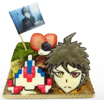
日向創の希望と絶望のケーキ 価格：850円