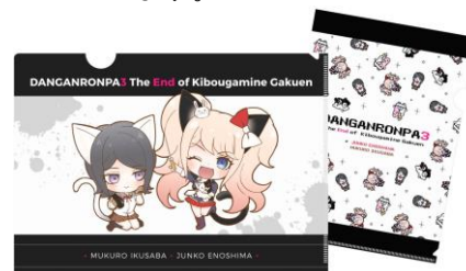
【クリアファイルセット(全7種)】 ※A4サイズ、2枚セット