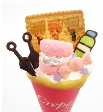
流流歌特製！76期生のどちゃくそ美味しいクレープ 価格：780円