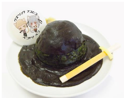
「お前には、本刀より竹刀がしっくりくん。」九頭龍&辺古山の主従ブラックカレー 価格：850円