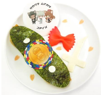
「この学園から俺は世界を変える。」桜舞う卒業式の誓い餃子 価格：780円