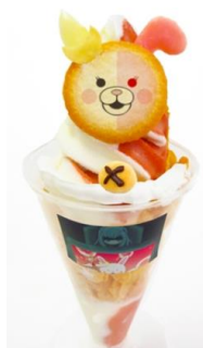
「最後にはきつとうまくいくはずでちゅ！」キュートで頼もしいモノミパフェ 価格：780円