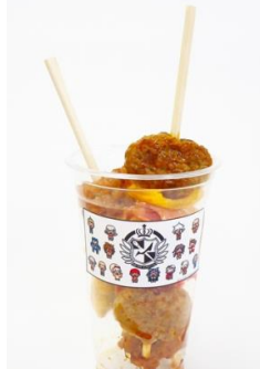
「私たちの未来は、みんなで作るんだよ。」77期生みんなで食べる希望の肉料理 価格：880円