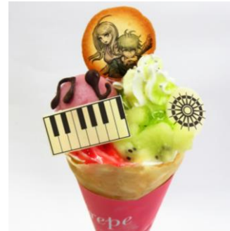
超高校級のピアニスト& 超高校級の???クレープ 価格：780円