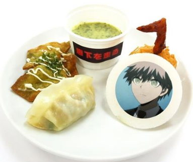
「信じあうことこそが僕らの希望！」 苗木のNG行動ディッププレート 価格：830円

2017年1月13日(金)からは、「ニューダンガンロンパV3」メニューが追加で新登場!!