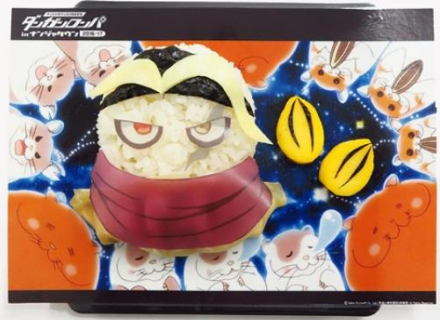
「行くぞ！十二神将たちよ！！」封印されし田中と十二神将たちの必殺プレート 価格：880円