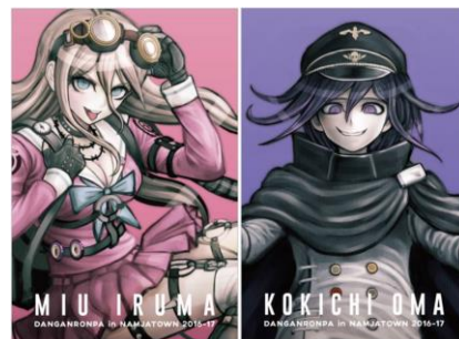
【ポストカード(全17種)】