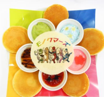
モノクマーズのスペシャル☆ パンケーキ 価格：950円

2017年1月13日(金)からは、「ニューダンガンロンパV3」メニューが追加で新登場!!