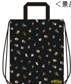
【ナップサック(全2種)】