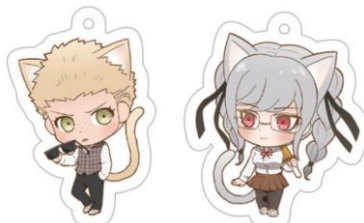
【メタルチャームコレクション (全22種)】※ランダム封入