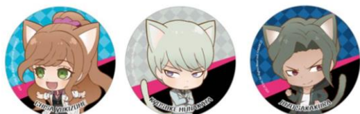
【缶バッジコレクション(全22種)】 ※ランダム封入