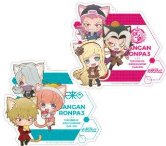
【BIG アクリルキーホルダー (全7種)】