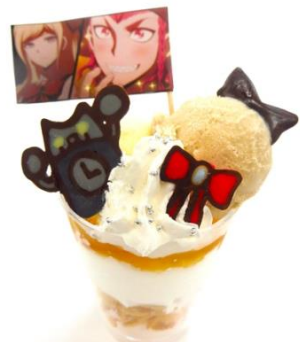
「かっこよかったですわ。」ソニアも認める左右田のメカバトルパフェ 価格：800円