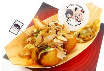
「評議員のおじさんから貰ってきたから。」絶望シスターズの網膜認証たこ焼き 価格：850円