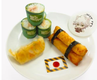
超高校級の幸運の持ち主狛枝のLUCKY☆セット 価格：880円