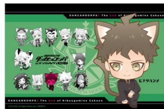
【ポストカード(全29種)】