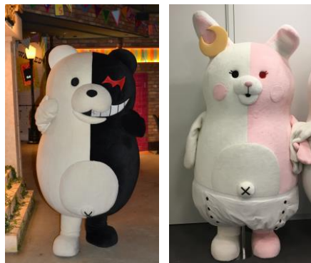
▲モノクマ(左)とモノミ(右)がやってくる！