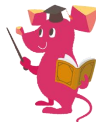
Space Designer検定試験 キャラクターの「リリアン」

検定試験に向けた勉強を通して、製図、インテリアの知識およびパース作成ソフトウェアを学習している方々が、業界で求められるスキルを身につけることができます。業界のプロが課題を作成し、パース画と提案書を評価基準に基づいて総合的に判定します。