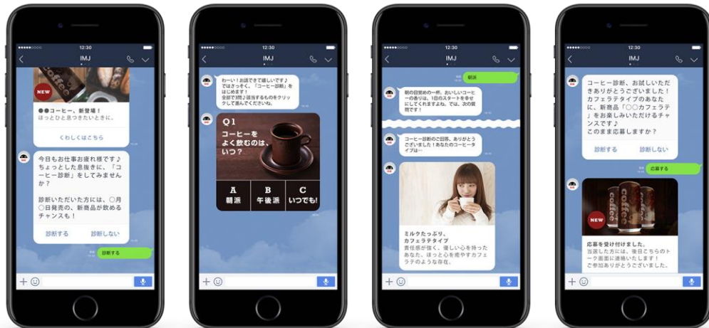
(例) ユーザーアンケート×コーヒー飲料

アンケート形式で情報を取得することで、購買意向の高いユーザーの選定や、ユーザーの嗜好に合わせた情報のセグメント配信など継続的なリレーションに繋げることができます。