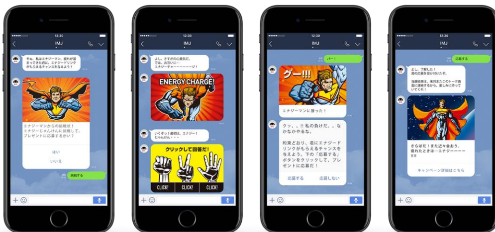
(例) ブランディングキャンペーン×エナジードリンク

LINEのトーク画面上で会話をしながら、自然な形で商品特性を伝達・ブランディング。ゲームなどユーザーを楽しませるコンテンツで、顧客とのエンゲージを深めることができます。