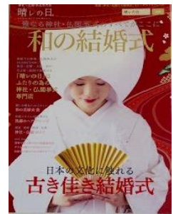
【2015年7月発刊のフリーペーパー】

【晴】＝アツパレ・素晴らしい日。皆さまにとっての新たな幸せや喜びを共有し、人生を豊かにする瞬間を思い描いて命名。