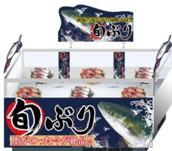
「松」アイテムを使った売場イメージ