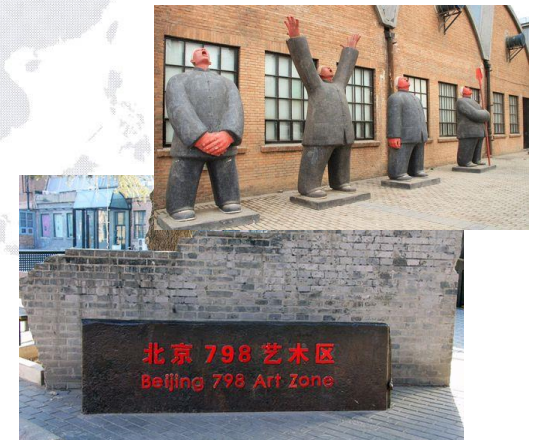
中国漫画家村北京拠点