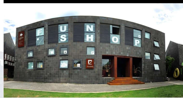
中国漫画家村杭州本部