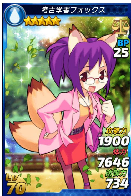
★5 「考古学者フォックス」