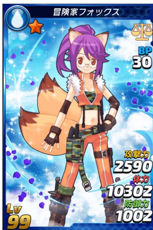
★6 「冒険家フォックス」