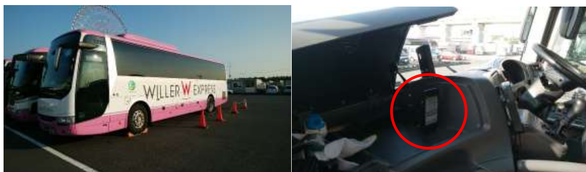
図 1.検証概要(左図:検証車両、右図:検証機器)

今般、更なる高速バスサービスの品質向上を目指し、利用者の乗り心地に影響する道路の凸凹や段差がある地点を見える化し情報共有することで、乗務員の運転技術の向上と、利用者の安心・安全性の向上へ向け連携を開始しました。