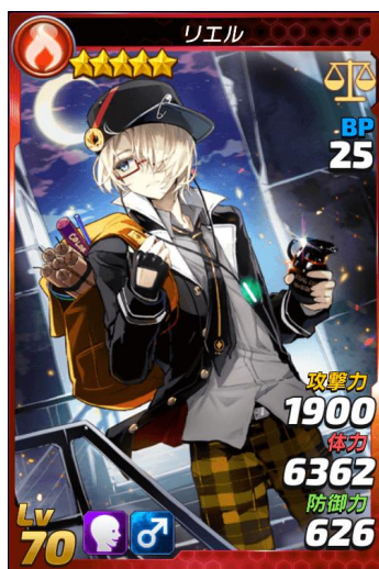
★5「リエル」 CV:須田 勝也