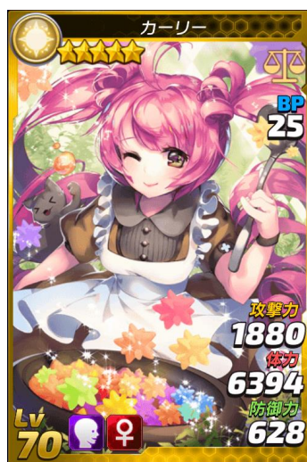
★5「カーリー」 CV:笹島 かほる