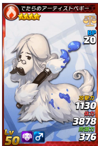
★4 でたらめアーティストペギー