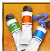
イベントアイテム「絵の具」