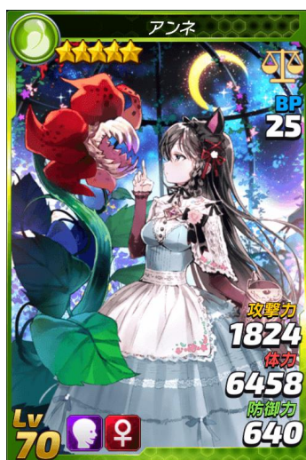
★5「アンネ」 CV: 石原 舞