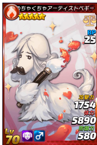
★5 めちゃくちゃアーティストペギー