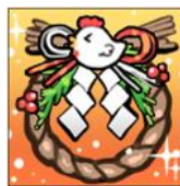
イベントアイテム「しめ縄」

さらにイベント期間中に★4召喚獣「ココ」を成長させて条件を達成した方には、召喚獣の成長に役立つアイテムをプレゼントいたします。