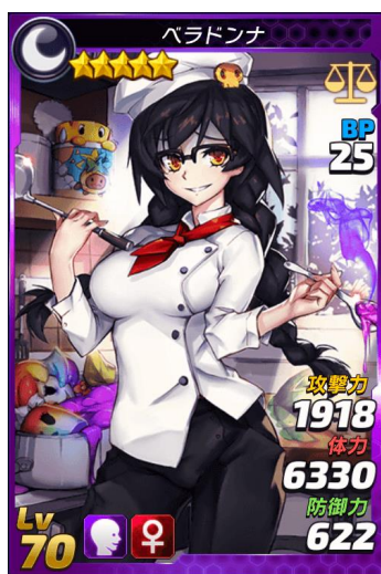
★5「ベラドンナ」 CV:あらい しずか