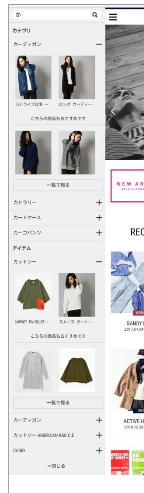
アメリカンラグシー オンラインショップ PC版のリッチサジェスト画面（上）