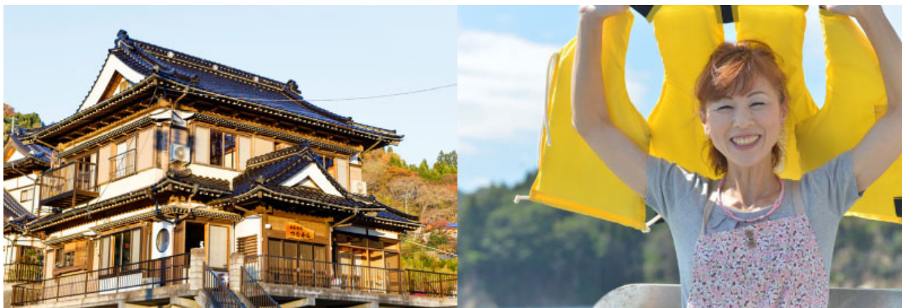
＜地方特派員ライターの記事 第 1 弾 宮城県気仙沼市の民宿「つなかん」とその女将＞

株式会社昭文社（本社：千代田区麹町、代表取締役社長 黒田茂夫、東証コード：9475）は、訪日外国人観光客向けの日本旅行情報 WEB サイト「DiGJAPAN!」が、外国人目線で地方の魅力を海外へ発信するために、日本各地で観光や地方創生に従事する方や地元大学生などを対象にライターを育成する「 地方特派員ライター制度 」を、2017 年 1 月よりスタートすることをお知らせします。