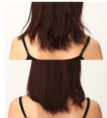
上) 使用前イメージ画像 下) 使用後イメージ画像