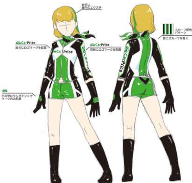
⑤xIIIRYOIIIx様作品 (④と同応募者様による2作目)