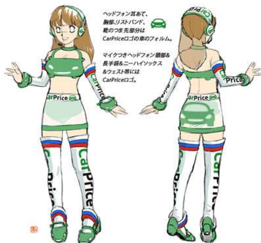
②志(こころざし)様作品