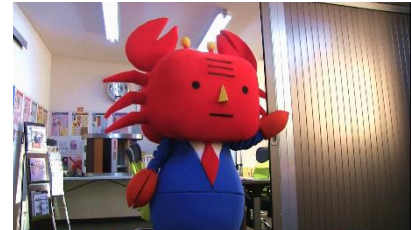
シャッターを開けながらカニ部長登場