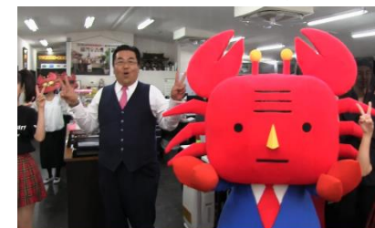
カニ部長と共に踊る社長