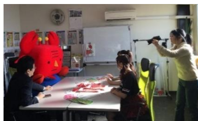
ミュージックビデオのメイキング風景