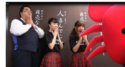
「静カニ！」社長に注意するカニ部長