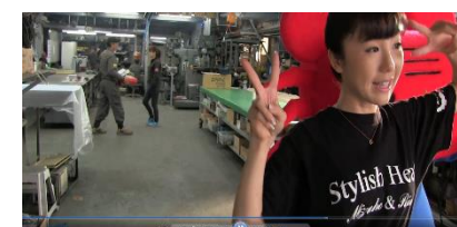
関係者以外立ち入り禁止の工場でも撮影