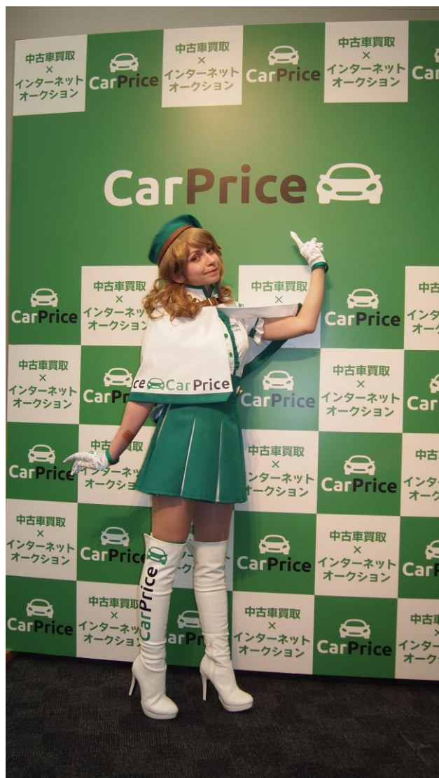
大賞コスチュームを着用したナスちゃん