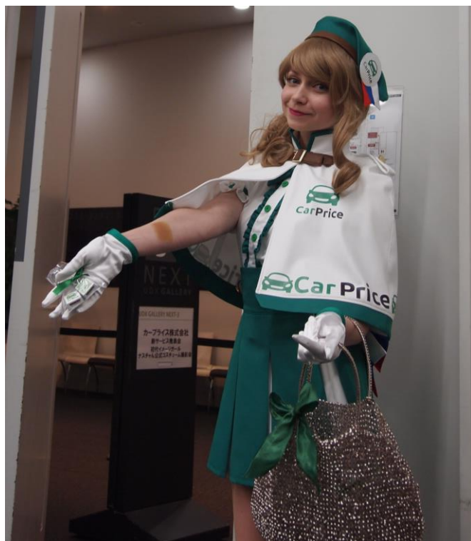
当社のロゴ入りチョコレートを配布するナスちゃん