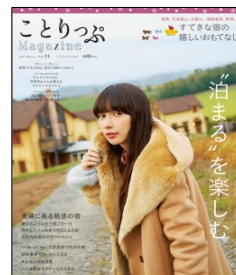
<ことりっぷマガジン (Vol.11 2017 冬号)>