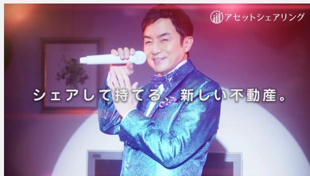
▲ イメージキャラクター 西郷輝彦