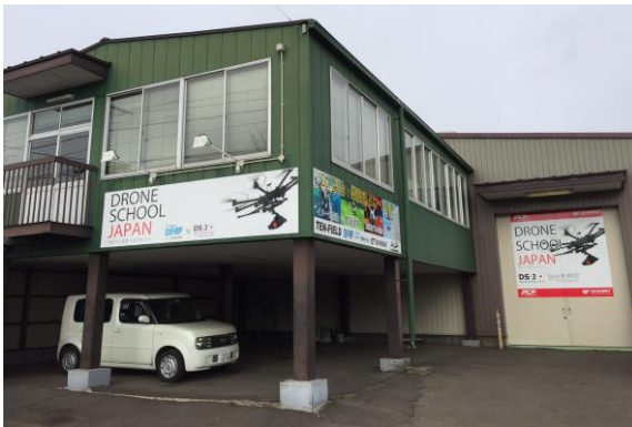
ドローンスクールジャパン仙台若林校 外観

産業用ドローンの開発・販売を行う株式会社スカイロボット（本社：東京都中央区、代表取締役社長：貝應大介）は、宮城県仙台市に『ドローンスクールジャパン仙台若林校』を 3 月 13 日に開校します。天候に関係なく操縦訓練ができる屋内飛行場を完備しており、急成長中のドローン産業で急務とされている操縦士育成を促進します。常設の屋内ドローンスクールは、東北初の開校です。