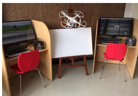
教習用のフライトシミュレーション