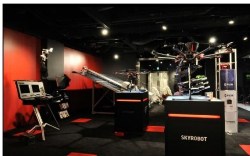
本社ショールーム