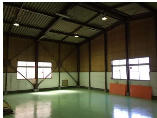
飛行訓練場に生まれ変わる天井高 6.5m の広い屋内