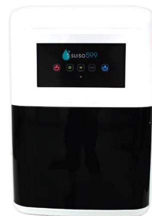
※画像は「水素ごつくく mini」

高濃度水素水サーバー「水素ごつくく」は 2010 年の発売からすでに 360 万リットルのご愛飲を頂いています。 毎日の飲み物・お料理にも使える水素水は、ミネラルウォーターや水道水の代わりとして使うことができます。