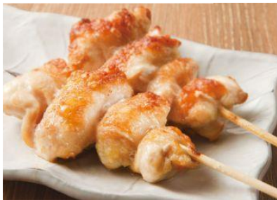
希少部位 ひなトロ