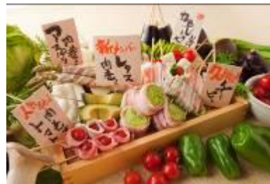
串市場(野菜の肉巻き串)