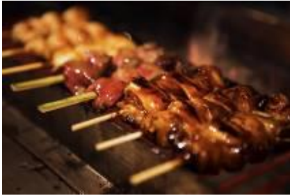
大山どりを使用。一本一本丹精込めて焼き上げてます

やきとり家すみれは、関東を中心に現在 67 店舗展開。大山どりを使用、バラエティ豊かな串焼き、自慢の手作り料理をこころゆくまで楽しめる、女性グループやご家族でも気軽に利用できるやきとり家です。名物の王様レバーは極みの鮮度！通も唸る逸品です。また、小学生以下のお子様はソフトドリンクを無料でサービスしております。週末はご家族でのお食事にもご利用できます。