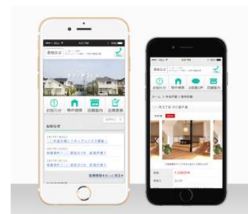
スマホ対応は無料プラン内

調査※によれば、スマホで物件を探したことがあると回答した割合は84.6%と高く、特に住宅の購入を検討している割合の高い30代の約9割の方が物件探しをスマホで済ませています。このようにスマホ対応はホームページ制作の基本となっている一方で無料でスマホ対応可能なホームページが作成できるサービスは非常に少ないのが現状です。スマーレは無料プランでもデザインは9種類からお選びいただくことが可能で、全デザインがスマホに対応しています。尚、デザインテンプレートのバリエーションは今後さらに増強していく予定です。 ※不動産情報サイト事業社連絡協議会のアンケート結果、2015年