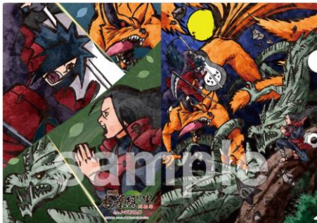
A4 クリアファイル (全 1 種 / 378 円)

※詳細は J-WORLD TOKYO 公式サイト( http://www.namco.co.jp/tp/j-world/ )でお知らせします。