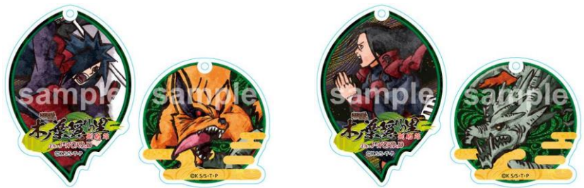
ペアアクリルキーホルダー (全 2 種 / 各 1,080 円)