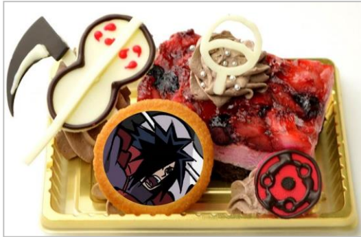
うちはマダラの “うちはこそが忍界最強 誰も止めることはできん” ケーキ (ダブルベリーケーキ) (700 円)

うちはマダラをイメージしたケーキです。 マダラの万華鏡写輪眼と武器のうちわをチョコで作って飾りました。