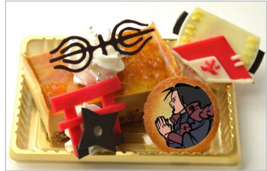
千手柱間の “今こそ見せよう！我が火の意志を！” ケーキ (キャラメルケーキ) (700 円)

うちはマダラをイメージしたケーキです。 マダラの万華鏡写輪眼と武器のうちわをチョコで作って飾りました。