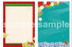
フォトフレーム 一例