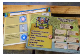
▲遊び方説明シート