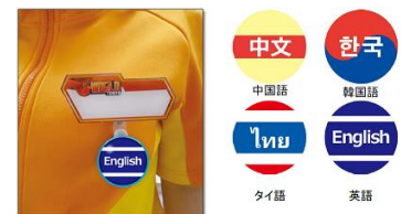
▲対応可能言語がわかるバッジ

話しかけなくても対応言語がひと目でわかり、海外からご来園のお客様にご好評いただいております。(スタッフは常駐ではありません)