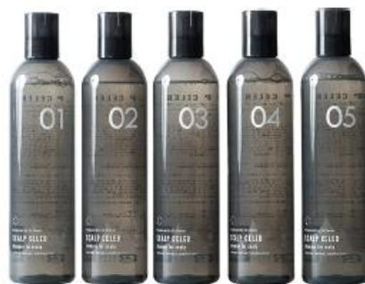
スカルプシャンプー「SCALP CELEB」