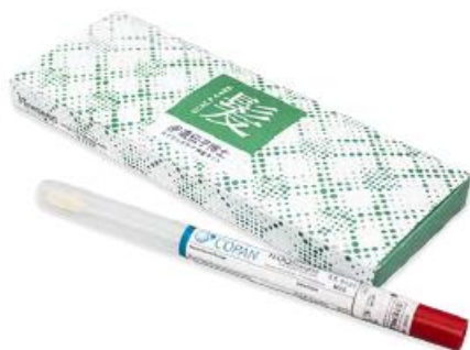
遺伝子検査キット「遺伝子博士エイジングケア」

遺伝的リスクに対応した5種類のシャンプーの中からあなたに最適なシャンプーをお届け。