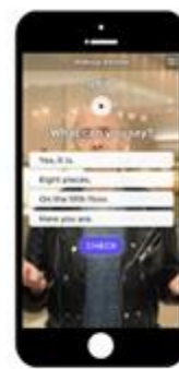
あなたの弱点に応じて 出題が変わる