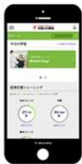
スマホ・タブレットで いつでも学習