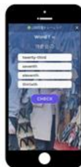
単語クイズで 語彙力アップ