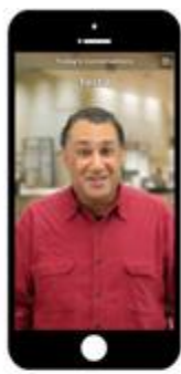
世界各国の 6 名のお客様