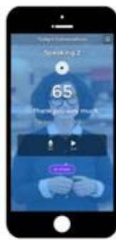
あなたの発音を すぐに採点