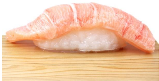
側面イメージ(大トロ)