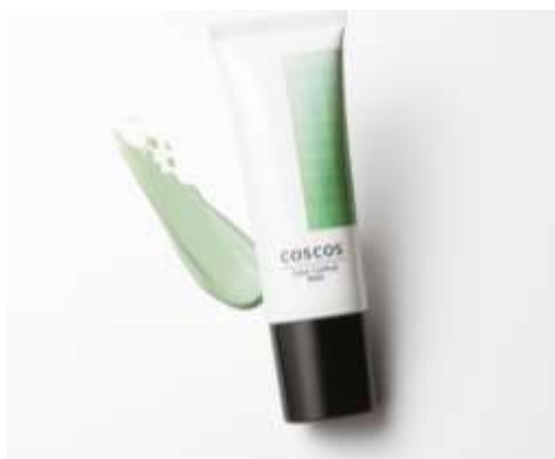
COSCOS カラーコントロールベース（グリーン 01） 商品画像