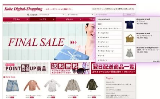
＜リッチサジェストのイメージ＞

検索時のサジェストとともに商品画像を表示する「リッチサジェスト」、商品を組み合わせたコーディネートコンテンツを簡単に作成できる「リッチコーデ」など、既存システムに単独で導入できる尖ったサービスも注目です！