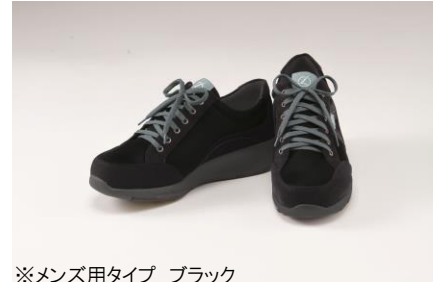
※メンズ用タイプ ブラック