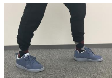
普通のスニーカー

「LOC0Xワイドステップウォーカー」のソールは健康歩行を促す形状になっています。