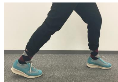
LOC0X ワイドステップウォーカー

アウトソールのかかと部・つま先にクッション材を内蔵。柔らかな履き心地を実現すると共に、クッションを踏みつけることで脚の筋肉活動量がアップします。砂浜を歩いているような感覚で脚を鍛えながら、楽に足を鍛える事が可能になります。