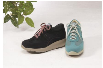
※レディース用タイプ 左:ブラック、右:ブルー