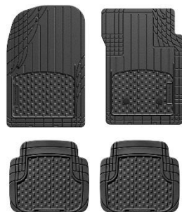
<リアセパレートタイプ>