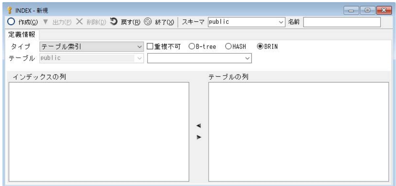
画面3. インデックス画面

インデックス画面において、BRIN の作成を行うことができるようになりました。インデックス画面では、B-tree/HASH/BRIN の 3 種類のインデックスを作成できます。(画面3)