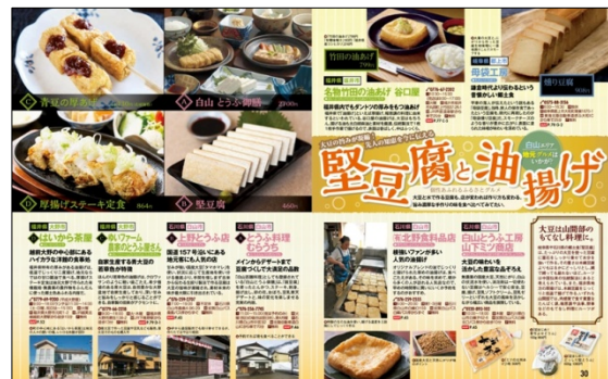
<「堅豆腐と油揚げ」誌面>