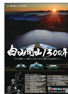
<ポスターイメージ>

ほか白山開山 1300 年 PR ポスターの制作も行い、既に各所での掲出が始まっています。昭文社ではあらゆる媒体、機会を通じて、白山開山 1300 年記念の各種事業、イベント、観光を盛り上げて参ります。