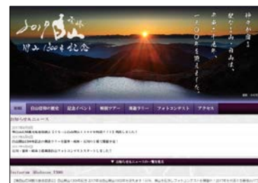
<ぐるっと白山 1300 年特設サイト TOP>

ほか白山開山 1300 年 PR ポスターの制作も行い、既に各所での掲出が始まっています。昭文社ではあらゆる媒体、機会を通じて、白山開山 1300 年記念の各種事業、イベント、観光を盛り上げて参ります。