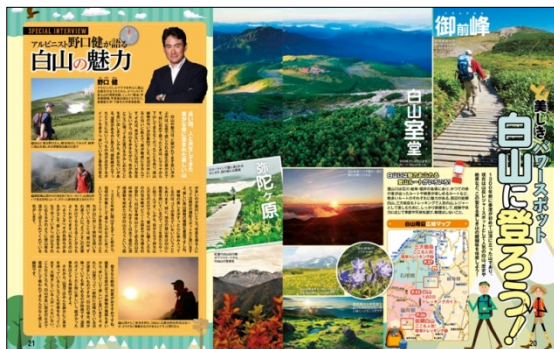
<「白山に登ろう！」誌面>

もちろん「まっぷるマガジン」シリーズならではの詳しい地図、おすすめプラン、おみやげ、イベントガイドも収録、初心者からリピーターまで白山エリアの魅力、旅の醍醐味を満喫できる一冊です。