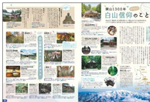
<パンフレット代表誌面>