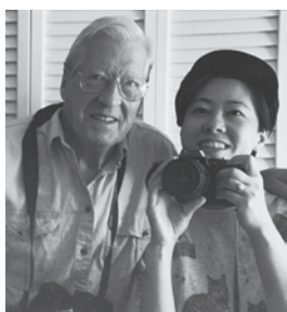
ジョー・オダネル Joe O'donnell

1922年、米ペンシルベニア州ジョーンズタウンに生まれる。1941年、米軍の海兵隊に志願。現像・撮影の訓練を受け1945年、占領軍のカメラマンとして来日。広島、長崎をはじめ各地の空襲による被災状況を記録。1946年、帰国後除隊。1949年、アメリカ情報局に籍を置き、ホワイトハウス付きのカメラマンとして勤務。4代の大統領に仕える。1968年退職。1989年、「Once」との出会いにより、反戦・反核の活動を展開していくことを決意。日米はじめ世界中で写真展・講演会を開催する。2007年8月9日、85歳で死去。