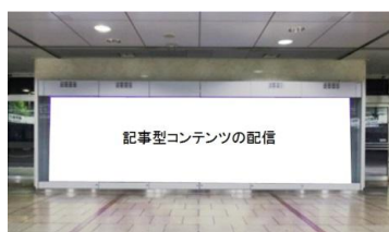
デジタルサイネージでの 要約記事型コンテンツの配信

株式会社ジェイアール東海エージェンシーは、東海道新幹線沿線エリアに拠点を持つ広告会社でありながら、東海道新幹線及び JR 東海在来線の交通広告メディアを経営資源として保有しており、ビジネスパーソンを中心に幅広いリーチを誇っています。一方当社は、テクノロジー分野に特化したインターネット専門のメディア企業であり、ものづくり分野についても MONOist ( http://monoist.atmarkit.co.jp/ )、TechFactory ( http://techfactory.itmedia.co.jp/ ) を代表として国内有数のオンラインメディアを保有しています。