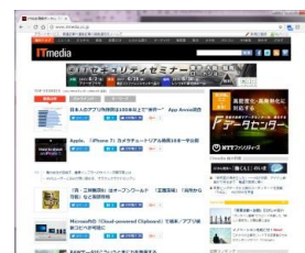
「ITmedia」(PC版及びモバイル版)での、 取材に基づく事業紹介等の企画記事掲載

今回の協業においては、1 日の輸送人員が約 45 万人(※)に及ぶ東海道新幹線の主要駅のデジタルサイネージを接点として、東海道新幹線を利用するビジネスパーソンをターゲットに当社オンラインメディア上の記事体広告へ O2O 誘導を図り、自社の認知度に課題を抱える B2B 企業のブランドリフトを実現する広告商品を提案します。東海エリアには、トヨタ自動車株式会社をはじめ、非常に有力なものづくり企業が数多く存在しており、両社は共同で同エリアからの顧客獲得を目指します。