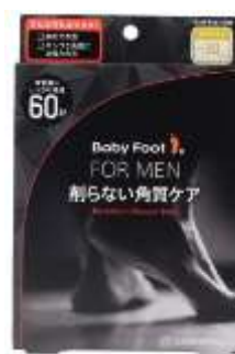
ベビーフット イージーバック DP60(メンズ)

普段お父さんとあまりコミュニケーションを取らないけれど、父の日にはプレゼントを贈ったり感謝の言葉を伝えたりと、日ごろの気持ちを「モノ」や「言葉」で表現する方が多いのではないのでしょうか。もちろん貰ったお父さんの嬉しい気持ちは大きいと思いますが、実際に「父の日」にしてほしいことについて、成人した子供と同居する父親 300 名を対象にした調査によると、48%が「一緒に過ごしたい」と回答。お父さんたちが「父の日」に求めているのは、「モノ」や「言葉」よりも「一緒に過ごす時間」のようです。※3