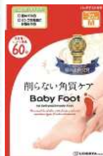
ベビーフット イージーバック DP60