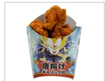
ギャリック砲からあげ