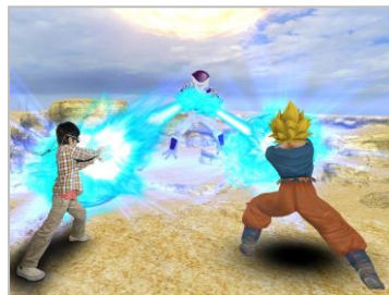
アトラクション 「はなとうぜ！かめはめ波！！」

実際に乗って撮影することができる宇宙船や、キャラクターになりきって撮影できるフォトスポット、J-WORLD オリジナルフードメニューなども充実！