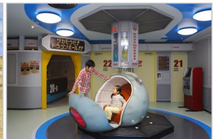
実際に乗ることができる フォトスポット