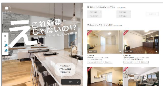
物件の魅力が最大限伝わるトップページ

自分らしい「暮らし」を考える様々なコンテンツを提供するオウンドメディアも制作予定です。