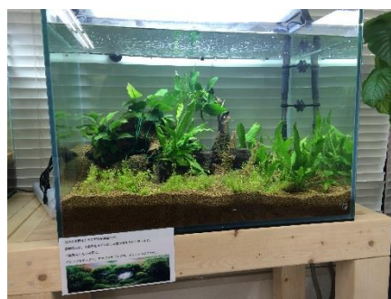
障がい者制作による水草を使ったアクアリウム

名称 : AQUALUXE (アクアリュクス) レンタル料 : 月額 20,900 円～ (消費税・レンタル料・メンテナンス費含む) レンタル期間 : 2 年間 レンタル内容 : アクアリウムを施した水槽 申込方法 : AQUALUXE 専用サイト http://aqua-luxe.jp/ 設置について : 設置前に下見にお伺い致します。