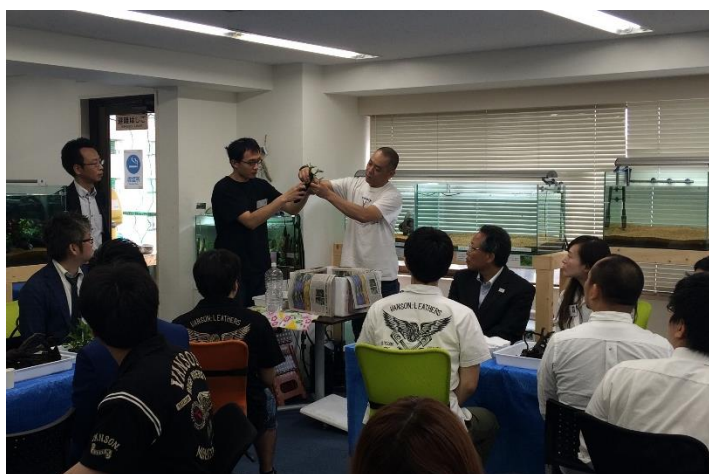
参加者の前で水草実習のレクチャーを行う当社カレントスタッフ

第2部は、当社独自の水草を使った就労移行支援プログラムの実習を、参加者全員で行いました。当社は、健常者と障がい者両者が共同作業を行う事により、普段外部や企業の人と接することがない障がい者たちは、導入企業からの参加者と直接コミュニケーションを取る事が出来、また導入企業からの参加者は水草プログラムの工程を実体験ができるいい機会