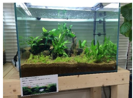
障がい者制作による水草を使ったアクアリウム

株式会社 LPH では、独自の水草育成プログラムを通じ、今後も充実した研修を実施し、障がい者と就労移行先の企業の幅広いマッチングサービスを行っていきます。